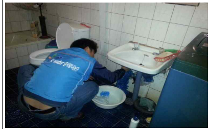
전기수도 점검 수리