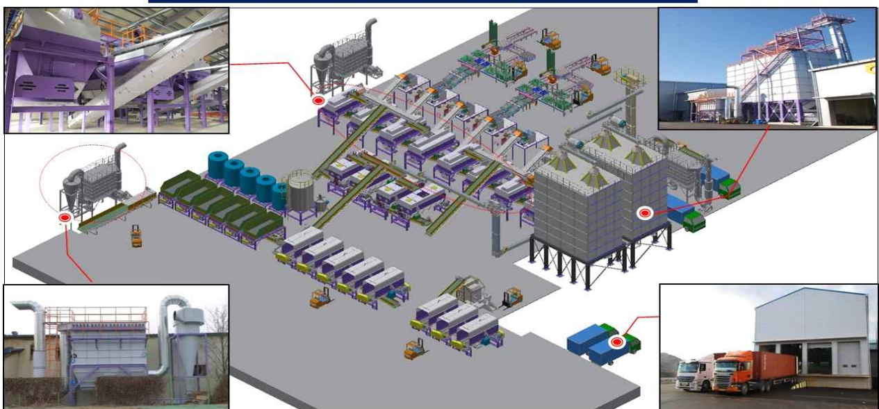
「저 메탄 조사료 종합유통센터」 설비 계획도