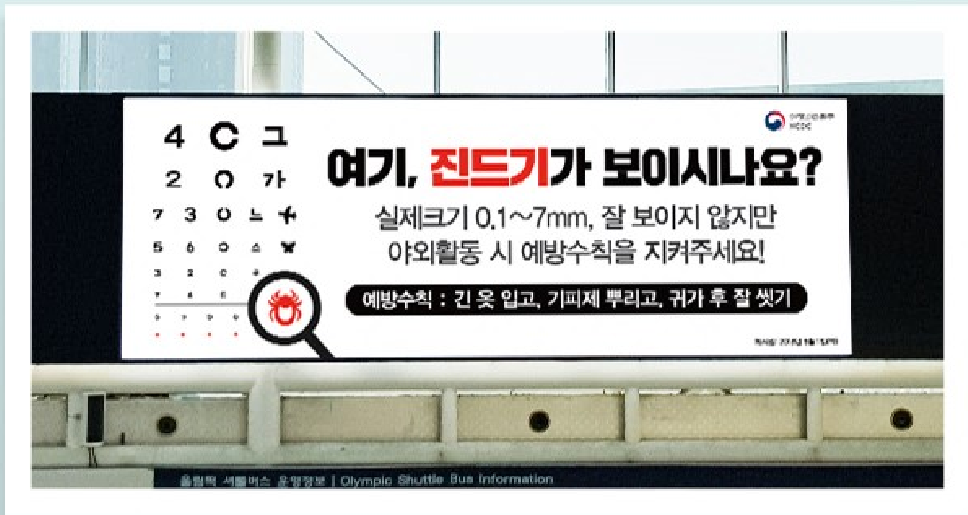
< 서울역 역사 옥외광고 . 2018년 05월 >