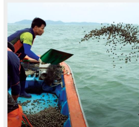
추진현황 및 향후계획