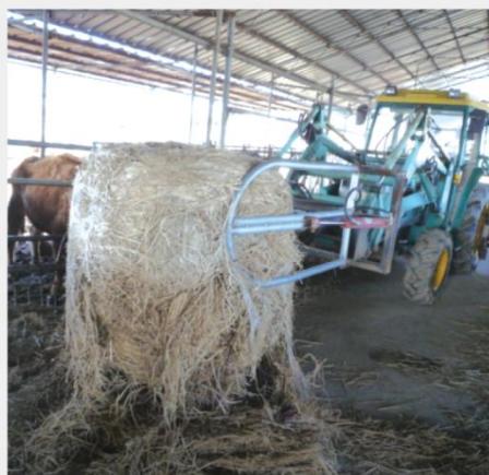
수당 지급 개요